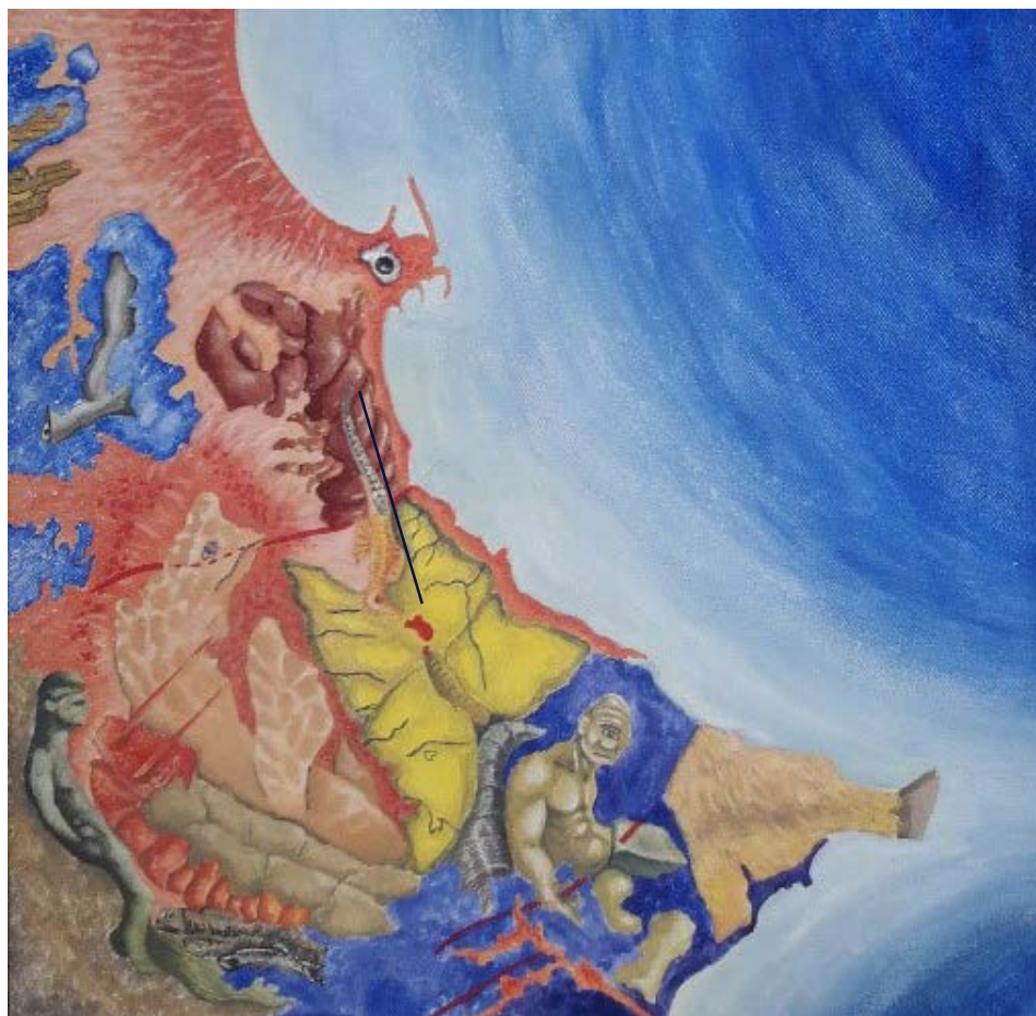
Mappa geo-sofica di Crotona

Evento organizzato nell'ambito della "Giornata Nazionale del Paesaggio" del 14/03/2022 (Verrà effettuato domenica 13/03/2022 per agevolare la partecipazione all'iniziativa)